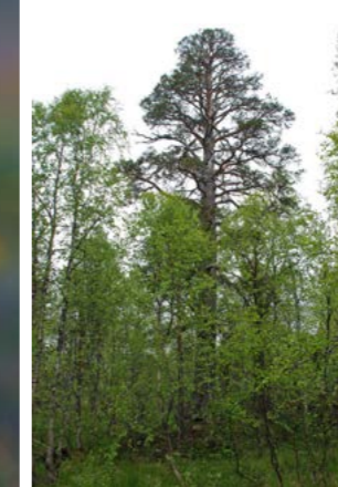
Enkelte gamle furuer står igjen.