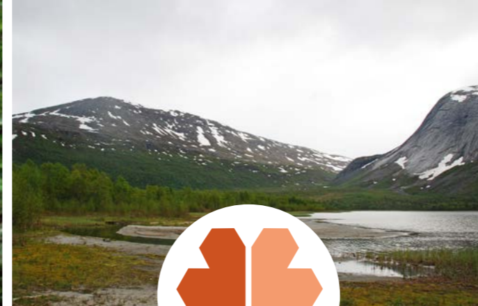
Sørøver i Sagvassdalen.