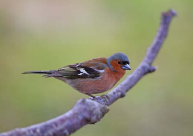
Bokfink. Også fuglelivet i områder er ganske rikt og variert.