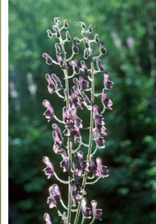
Tyrhjelm er vanlig i de frodige partiene.