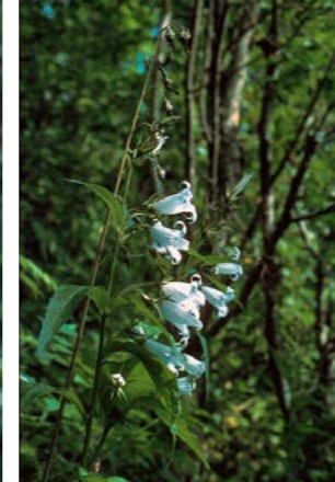
Storklokke har her en av sine største forekomster så langt nord.