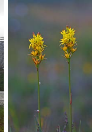
Rome er vanlig på fattigmyrene.