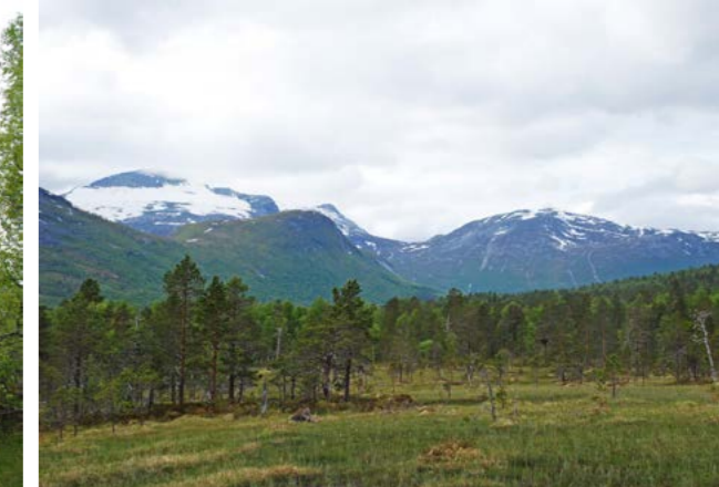
Gammel furuskog ved Slättelva.